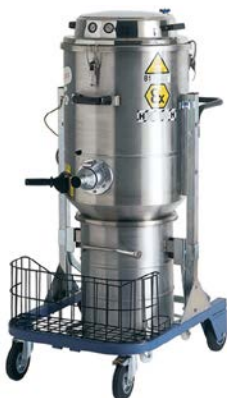
SO -Datenblatt Staub (1)