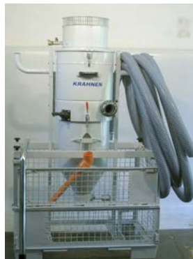
SO -Datenblatt Staub (4)