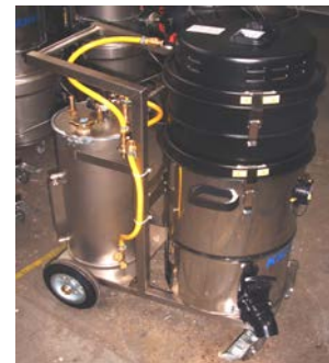
SO -Datenblatt Flüssig (1)