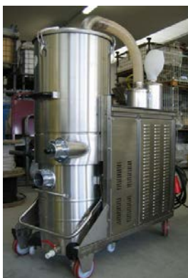
SO -Datenblatt Staub (4)