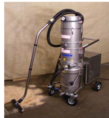
SO -Datenblatt Staub