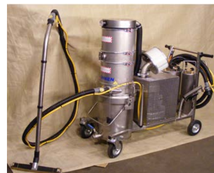
SO -Datenblatt Staub (1)

Ein kleiner Auszug aus unserem Sonder-Saugerprogramm. Unser Baukastensystem ermöglicht individuelle Lösungen für vielfältige Problembereiche.