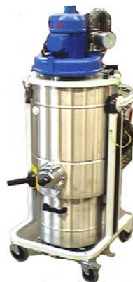
SO -Datenblatt Staub