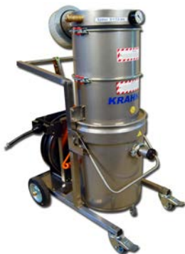
SO -Datenblatt Staub (1)