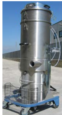
SO -Datenblatt Staub